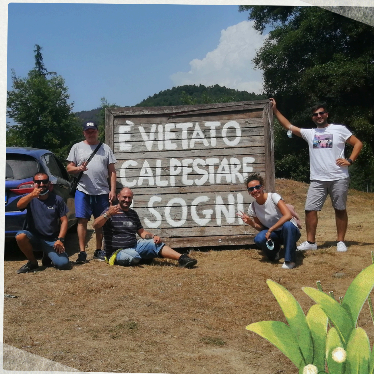
Organizzazione del tempo libero