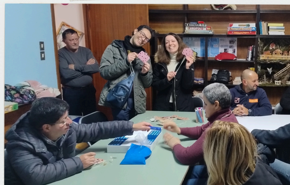
Attività di animazione