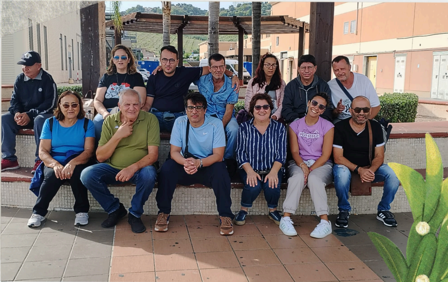
Giornata Mondiale della Salute Mentale 2024

Sviluppiamo Percorsi Personalizzati di inclusione orientati all'accompagnamento alla cura di sé, all'inserimento sociale, alla formazione al lavoro e alla sperimentazione dell'abitare in autonomia.